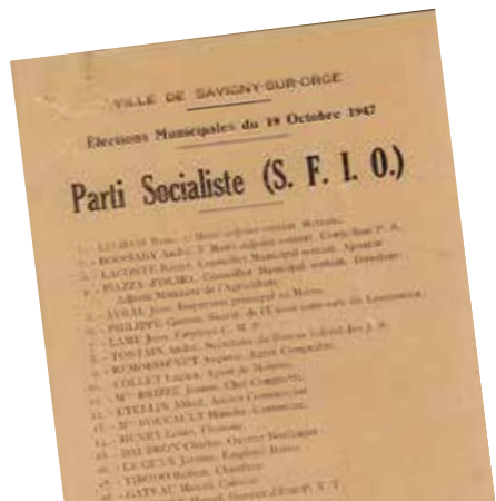
Bulletin de vote de la SFIO aux élections municipales de 1947. Quatre femmes se présentent sur une liste de 27 personnes.